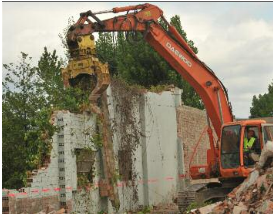
Rien de tel que l'action des engins pour tourner radicalement une page de l'histoire locale : abattoirs et dépôts de la Cavale vont laisser place à un parking aménagé de trois cents places.

Au début du mois de juin, les services du tourisme vont prendre leurs nouveaux quartiers dans les locaux rénovés de l'ancienne gendarmerie. La proximité de l'immense parking devrait faire affluer les touristes. ■