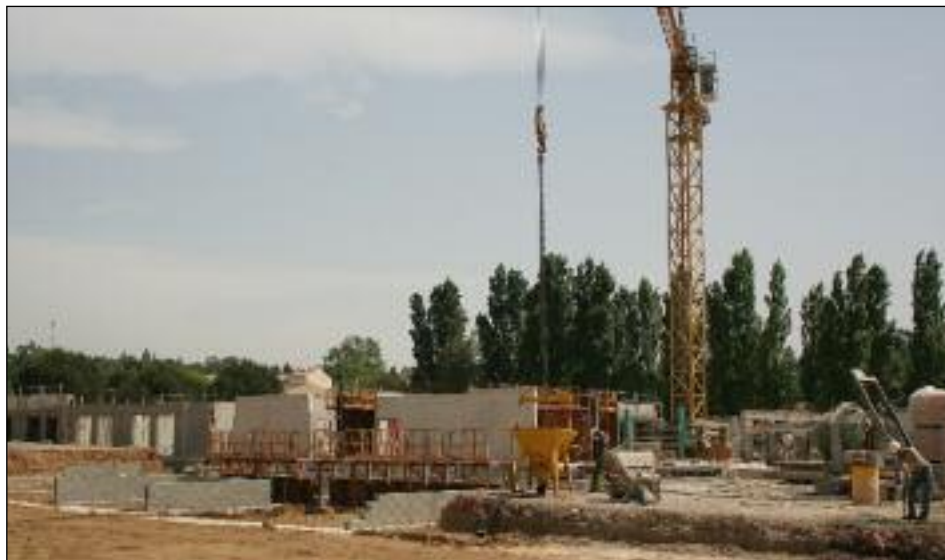
Le chantier avance vite et la maison de retraite élève déjà les murs des futures chambres du rez de chaussée.

Dès les premiers jours de l'année, comme annoncé, les travaux de la future maison de retraite de l'hôpital local ont débuté. Les fondations ont été creusées, les dalles réalisées et les murs sont en cours de montage. Une visite sur le chantier donne une juste idée de l'ampleur des travaux. Le bâtiment, qui couvrira plus de 6000 m 2 de plain-pied, devrait être terminé pour le mois de juin 2010. La centaine de pensionnaires actuels de la maison de retraite de l'hôpital local aura alors chacun sa chambre individuelle. L'hôpital local va en profiter pour restructurer ses services après avoir récupéré les 2000 M 2 de l'ancienne maison de retraite ■