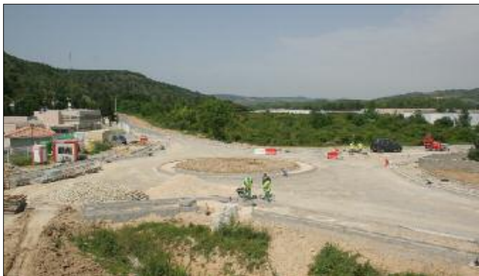
Le désenclavement de la nouvelle gendarmerie constitue aussi le premier tronçon de la future déviation vers Castelnaudary.

Cette rue, partant du rond point d'Intermarché, et son rond point au niveau de la nouvelle gendarmerie constituent aussi le premier tronçon de la future route de Castelnaudary. ■