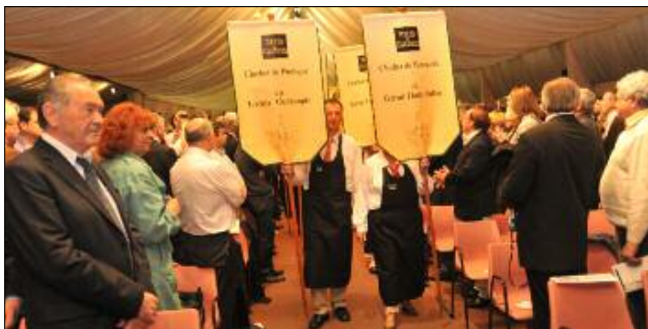
La vente aux enchères reste un grand moment de Toques et Clochers