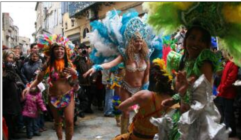
Les Brésiliennes ont fait monter la température autour des Arcades. Un vent de folie applaudi par une foule nombreuse

Carnaval 2009 a innové. A l'heure du bilan de cette édition, des évidences s'imposent. La grande nouveauté des Carnavals du monde, la veille de la sortie de toutes les bandes, a créé une animation complémentaire qui a drainé beaucoup de monde. Le coup d'essai est donc un coup de maître et cette "ouverture" s'avère une excellente initiative. Le succès que lui a fait le public n'enlève rien aux autres manifestations de Carnaval. Les différentes sorties et la sortie de toutes les bandes n'ont été en rien affecté par cette nouveauté : au contraire. Le cru 2009 est donc particulièrement réussi. Il restera comme celui de la naissance des "carnavals du monde". ■