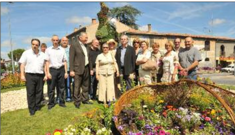
Le rond point de la route de Chalabre et son Pierrot animé ont fait l'objet de toutes les attentions. ■

Le rond-point du 8 mai, plus connu comme celui de la route de Chalabre, a été considérablement modifié. Pour marquer la fin du chantier (coût total de 25.000 euros) de voirie mais aussi d'aménagement floral, le maire accompagné de conseillers municipaux, s'est rendu sur les lieux afin de constater l'ampleur du travail accompli. Les services des serres municipales méritent un coup de chapeau pour le travail de fleurissement général sur la ville mais aussi particulier sur ce carrefour. Quant au Pierrot, au centre du rond-point, il est désormais mobile et tourne sur lui-même : les automobilistes sont surpris et les touristes apprécient. ■