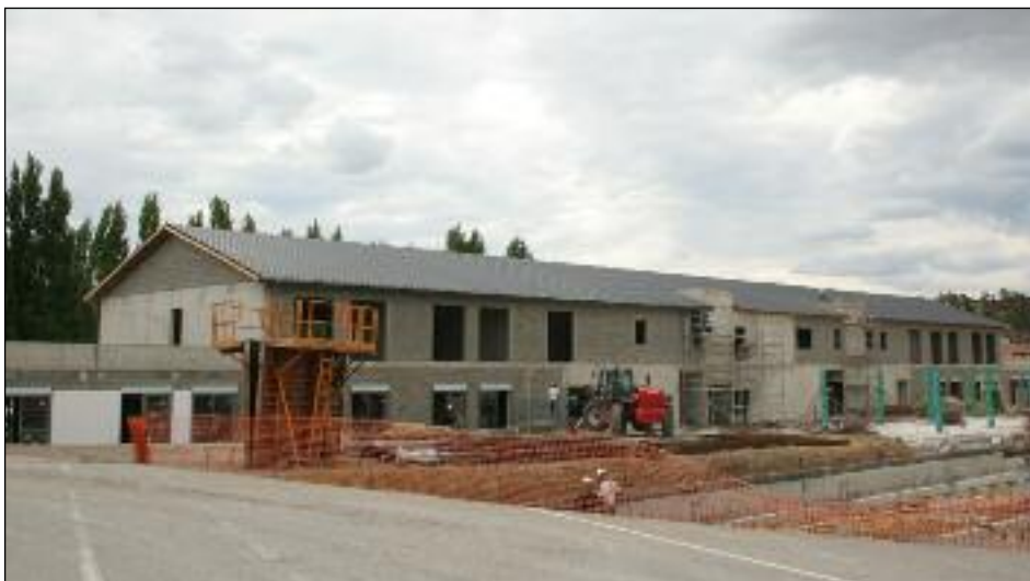
La friche industrielle de l'ancienne tuilerie reprend vie. ■

La future maison de retraite de la ville est largement sortie de terre. Roman Cencic, directeur de l'hôpital local, a invité les membres du conseil d'administration de l'hôpital et les élus à une visite du chantier. Une aile déjà vue le jour et les fondations des autres parties du bâtiment sont visibles. Tout devrait être terminé en juillet 2010. Le total des tra-