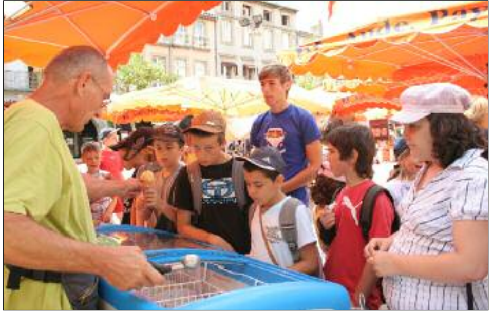
Les enfants ne sont pas les derniers à vouloir savourer les délicieuses glaces artisanales. ■

De leur côté, les touristes, très nombreux dans notre région durant les vacances d'été, découvrent des recettes jusqu'alors inconnues, et donc de nouvelles saveurs. ■