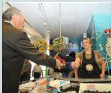
Un nouveau cadre apprécié de tous les utilisateurs, commerçants comme clients. ■

Cette réfection a fait l'objet d'une inauguration en présence du député maire, de plusieurs conseillers municipaux, des entrepreneurs en charge des travaux. ■