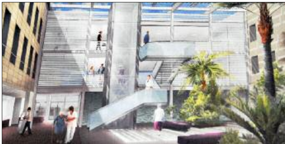
Une idée de ce que devrait être le nouveau bâtiment équipé de chambres individuelles. ■

L'hôpital local vient de choisir son projet architectural de réhabilitation. La cure de jouvence qui s'annonce est importante et durera trois ans à partir de fin 2010 où les travaux débiteront. L'enveloppe est de 12 millions d'euros. Le choix s'est porté sur l'aspect fonctionnel et sur l'intégration visuelle au site environnant. Le projet ambitieux s'articule autour d'un atrium construit sur le patio actuel qui sera