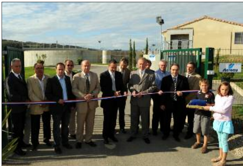
Une réalisation commune, un bon point pour l'environnement. ■

D'un coût total d'environ 10 Millions d'euros (station et canalisation depuis Limoux jusqu'à Cépie) cette