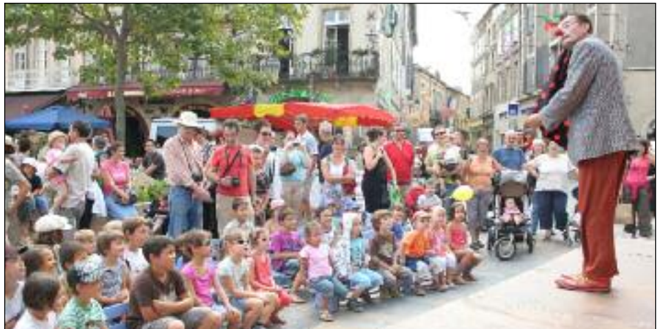
Fou rire garanti devant les pitreries du clown. ■