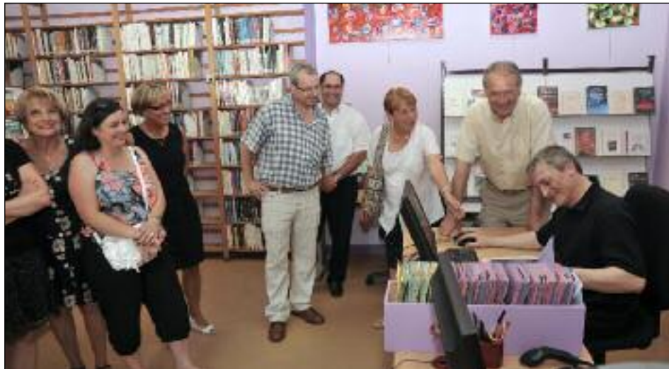
Le maire et son conseil municipal sont venus se rendre compte sur place des travaux effectués. ■