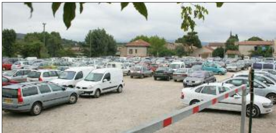
Plus de problème pour garer son véhicule les jours de marchés. ■

Le nouveau parking, réalisé sur l'ancien site des entrepôts de la Cavale et des abattoirs, a vécu son premier été. Utilisé début juillet, quelques jours après la fin des démolitions, pour implanter les arènes espagnoles de la feria, il a ensuite servi pour ce qu'il est : un lieu de stationnement.