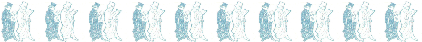
«personnages du Peintre Jeanne SOCQUET d'après DAUMIER»

ASSOCIATION NATIONALE des AVOCATS pour la SAUVEGARDE des ENTREPRISES et leur DEVELOPPEMENT