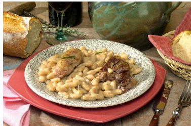
Suggestion de présentation

Noix de joue de porc confites 32 pièces 4200g Salées puis lentement confites dans de la graisse de canard, ces noix de joue de porc seront délicieuses accompagnées de lentilles, de petits pois, de pâtes, de haricots lingots, de purée ou de pommes de terre. Vous pouvez également utiliser la graisse de canard pour faire revenir vos viandes, rissoler vos pommes de terre ou sauter des haricots verts. Sans sel nitrité ni polyphosphates