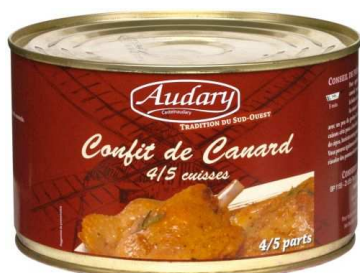
Le Confit de canard