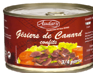
Les Gésiers de canard confits