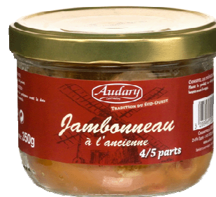
Le Jambonneau à l'ancienne