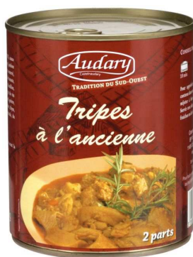
Les Tripes cuisinées à l'ancienne