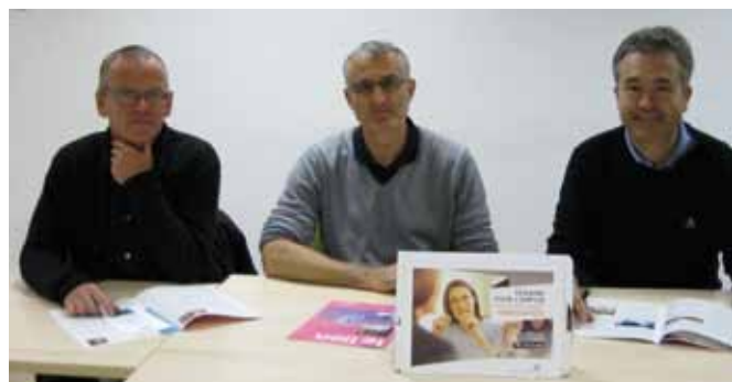
Photo réalisée durant la SEPH 2014 à Perpignan, en présence du référent handicap du métier du courrier.