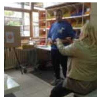
Photo réalisée durant la SEPH 2014 dans la Nièvre à Clamecy et à Corbigny. La fédération Handisport a animé une activité de tir à la sarbacane.