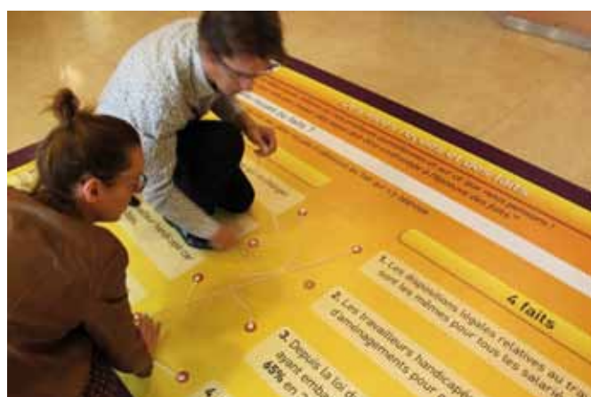
Des jeux pour sensibiliser au sujet du handicap