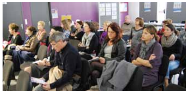
A Limoges : table ronde sur le thème des handicaps invisibles