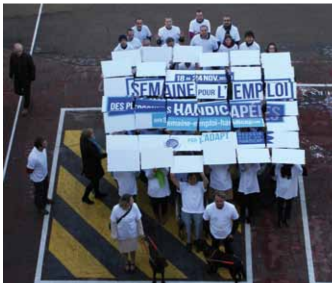
A Châlons en Champagne

Du lundi 18 au vendredi 22 novembre 2013, vous avez été nombreux à vous mobiliser pour représenter l'atha à l'occasion des évènements organisés durant la semaine de l'hangement chez Orange et la semaine pour l'emploi, SEPH, à La Poste.