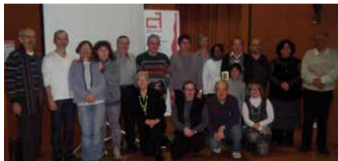
Les adhérents de la section Rhône-Alpes

année, ils ont partagé à un grand moment de convivialité et d'échanges. P. Persoglia