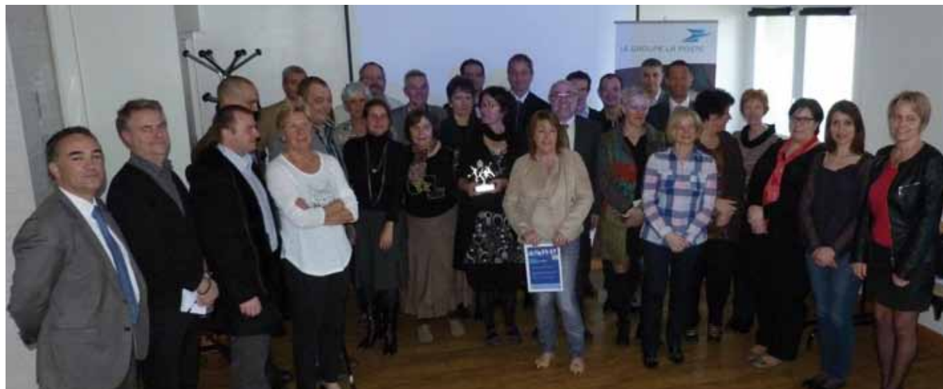
Les lauréats des trophées en région Bourgogne