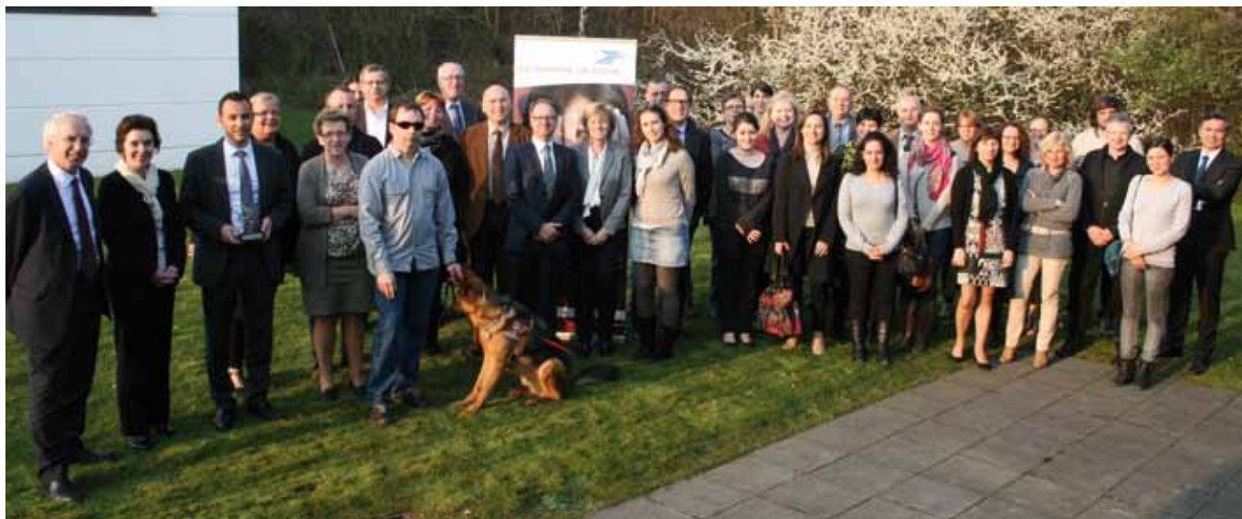
Les lauréats des trophées en région Nord Pas de Calais

De cette journée handifférences, je retiens ceci : le handicap à La Poste n'est plus vécu comme une peur, une réticence, mais un enrichissement au sein de l'entreprise, d'où, un grand pas en avant