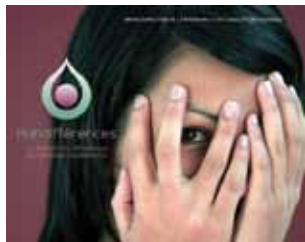
L'affiche Handifférences et le trophée régional

Après l'implication des correspondants locaux et des adhérents de l'atha dans les jurys handifférences en régions, en février et mars dernier, notre Présidente est conviée à participer au jury national en avril. La remise des prix nationaux aura lieu à Paris en juin 2014. Voici quelques témoignages de correspondants de l'atha et de postiers.