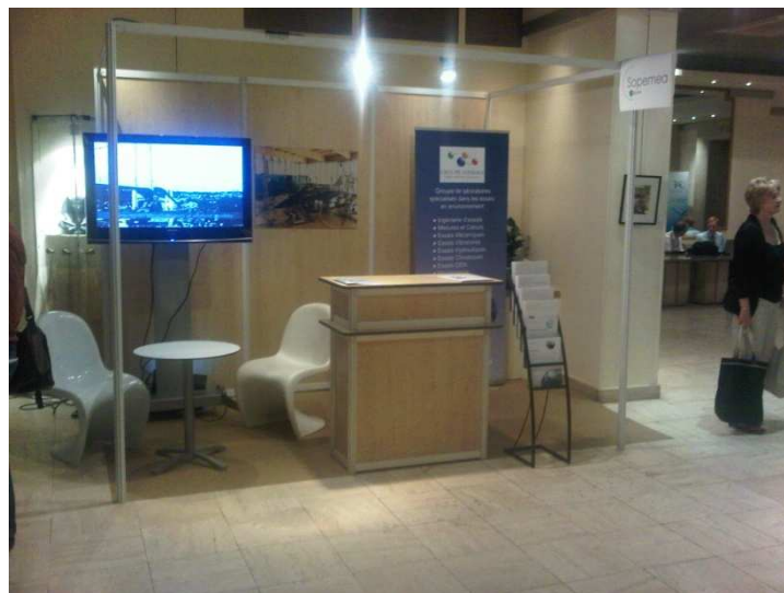
Exemple de stand de 6 m2