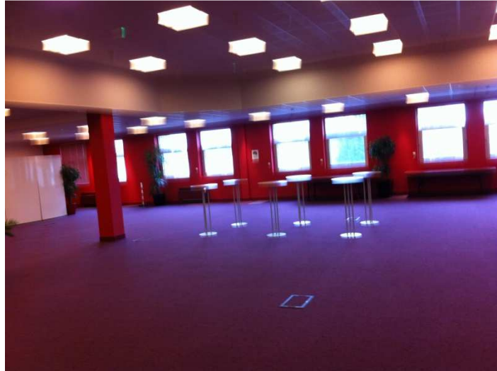
Photo de la salle d'exposition

July 3, 4 and 5, 2012 Centre de recherche EDI de Clamart