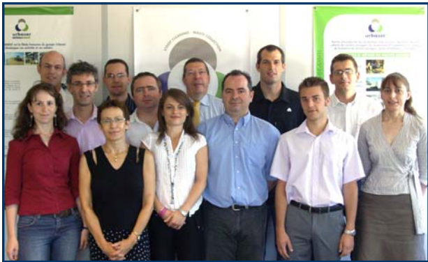
L'équipe EVAR à Montpellier

Dès le mois d'août prochain, un bureau Evar ouvrira ses portes à Roanne, en centre ville : ce bureau accessible à tous, permettra au public, associations et élus de bénéficier d'une présence locale permettant d'optimiser l'information et la communication sur le projet.