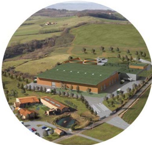
Vue architecturale du projet