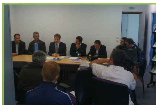
20 juillet 2011 : Conférence de presse organisée par Urbaser Environnement et ses partenaires