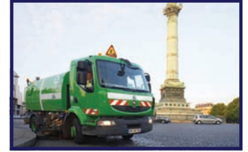
Ville de Paris