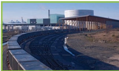
Fos sur Mer