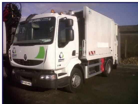
Collecte : La Rochelle