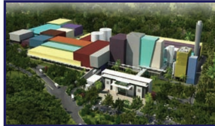
Pointe à Pitre