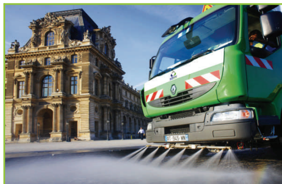
Propreté/Nettoisement : Paris