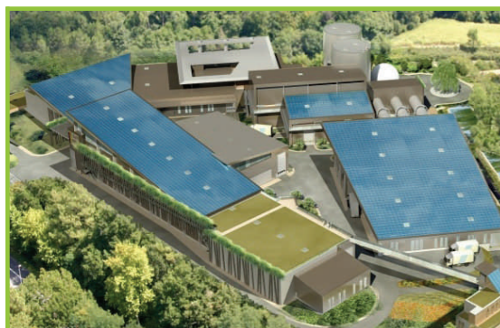
Traitement : Bayonne